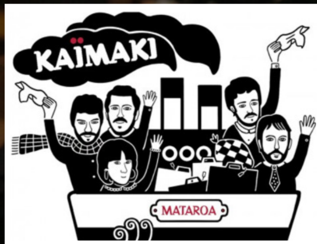
Illustration Pochette : Zeina Abirached

Le groupe, du nom de cette célèbre glace au mastic, est né en 2010 d'une entente humaine et de la volonté de développer ce projet autour de la Grèce, du jazz et de la poésie.